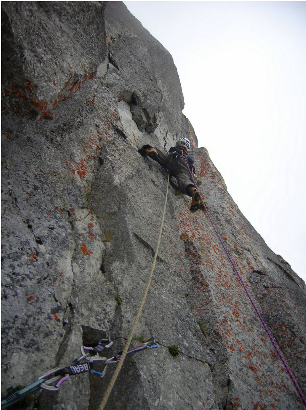
La troisième longueur en 7a