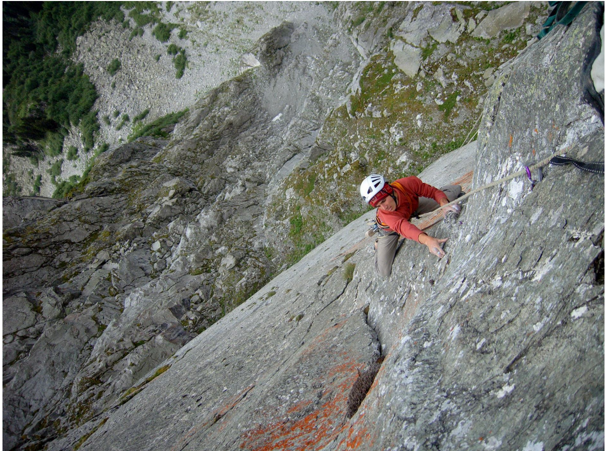
Lors du repérage de la 6 ème longueur en 7a+